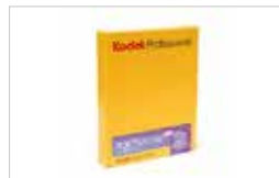
4X5" - KODAK PORTRA 160 BOITE DE 10