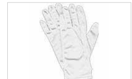
PAIRE DE GANTS DE LABORATOIRE