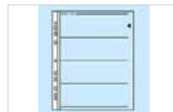
LOT DE 25 FEUILLETS ACETATE 120 - PANODIA