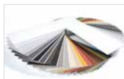
PASSES-PARTOUT SUR MESURE 16 COLORIS AU CHOIX