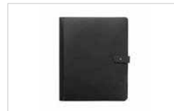
BOOK PAMPA NOIR, 21X30, 10 FEUILLETS