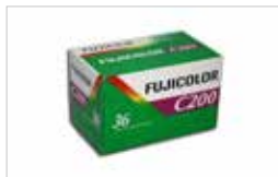
135 FUJI C200 36 POSES