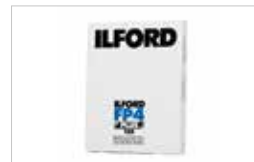
4X5" - ILFORD FP4+ 125 BOITE DE 25