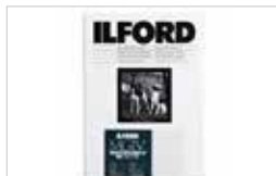
ILFORD NB ARGENTIQUE RC PERLÉ 17,8X24 CM