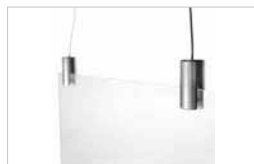
KIT DE SUSPENSION PAR CÂBLE