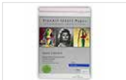
HAHNEMÜHLE PHOTO RAG 308G A4 ET A3+