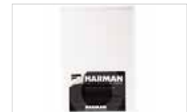
PAPIER POSITIF DIRECT ILFORD 5X7IN