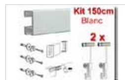
KIT CIMAISE COMPLET LONGUEUR 1.50M DE COULEUR BLANC