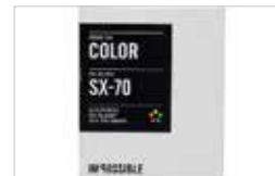
IMPOSSIBLE - COLOR SX-70