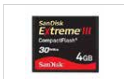
COMPACT FLASH 4 GO SANDISK