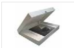
BOITE D'ARCHIVAGE HAHNEMÜHLE