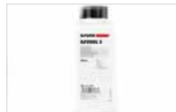
RÉVÉLATEUR FILM N&B ILFORD ILFOSOL3 500ML