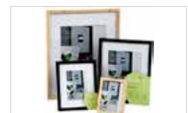
PLUS DE 200 RÉFÉRENCES DE CADRES NIELSEN STANDARDS ET SUR-MESURE ...