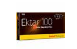
120 - KODAK EKTAR 100 PACK DE 5 FILMS