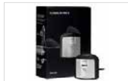
SONDE X-RITE EYE ONE DISPLAY PRO