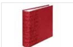
ALBUM SCRIBE ROUGE 22X22 200 VUES 10X15