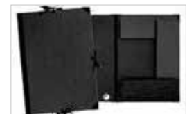
CARTON À RABAT