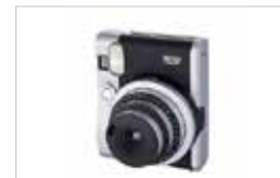
INSTAX MINI90 NEO CLASSIC